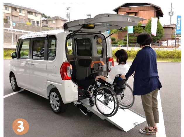
▲車種「タント」 車椅子ごと乗れるタイプです。