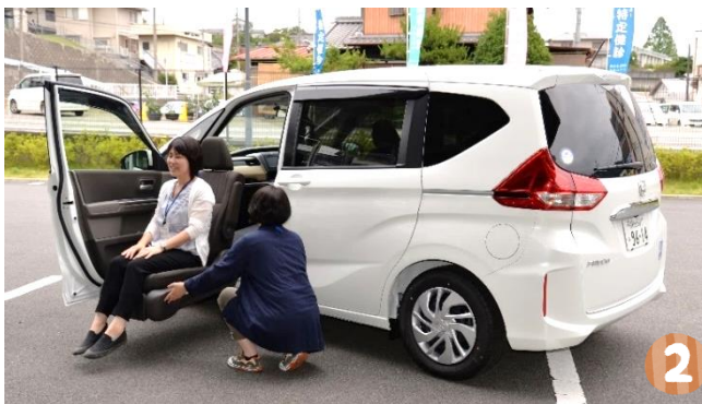
▲車種「フリード」 助手席が外まで降りて乗り降りしやすいタイプです。