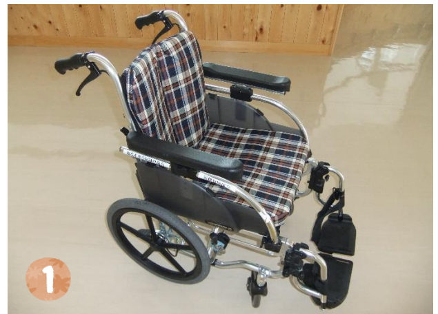
▲介助用と自走用の2タイプがあります。

市内在住の障がい者、高齢者、歩行が困難で車椅子を利用されている方。利用期間は、原則3日以内です。費用は無料ですが、使用燃料のみ負担していただきます。希望する日の3か月前から1週間前までに申請が必要です。何れも利用前にお電話で空き状況等をご確認ください。